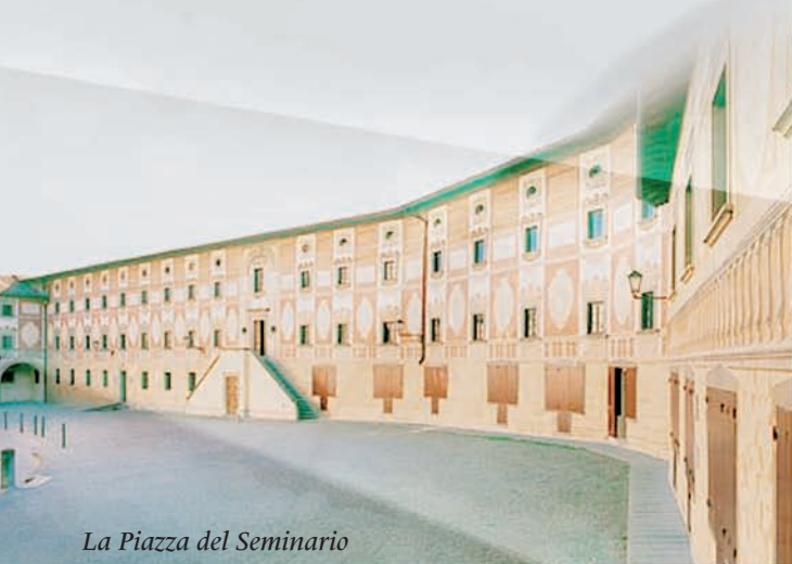
La Piazza del Seminario

Da sempre il teatro dà voce alla domanda di senso che interroga l'uomo di fronte alle speranze e alla fragilità del vivere, alla fatica della malattia, all'angoscia della morte. Oggi più che mai, il teatro si offre come strumento di comunicazione del vissuto religioso e dell'esperienza spirituale profonda: dall'appartenenza a una comunità alle espressioni popolari della fede, dalla liturgia alla preghiera fino all'intuizione mistica. Una spiritualità incarnata, capace di rispondere a un sempre più diffuso bisogno di silenzio e di autenticità. Sulla scia del successo de I Teatri del Sacro , l'appuntamento di San Miniato è l'occasione per una riflessione che sia frutto del vivo incontro tra l'arte teatrale e l'esperienza del sacro, in un faccia a faccia tra artisti, teologi, studiosi e quanti si occupano di cultura nella comunità cristiana.